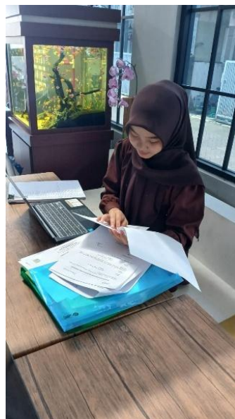
Gambar 5. Kegiatan Input Data ke KKP

Kegiatan ini secara signifikan meningkatkan kompetensi teknis mahasiswa, khususnya dalam memahami prosedur pasca-audit dan penyusunan kertas kerja pemeriksaan. Selain itu, kegiatan ini juga berkontribusi terhadap pengembangan soft skills , seperti ketelitian, kemampuan bekerja secara sistematis, manajemen waktu, serta kemampuan bekerja di bawah tekanan, mengingat proses audit di Kantor Akuntan Publik umumnya dibatasi oleh tenggat waktu yang ketat. Proses pelaksanaan kegiatan penginputan data ke KKP yang dilakukan mahasiswa dapat dilihat pada Gambar 5 berikut: