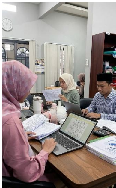
Gambar 6. Review CaLK

Kegiatan ini tidak hanya meningkatkan kompetensi teknis mahasiswa dalam memahami hubungan antar dokumen audit, tetapi juga berkontribusi terhadap pengembangan soft skills , seperti ketelitian, tanggung jawab, serta manajemen waktu. Hal ini dikarenakan proses audit di Kantor Akuntan Publik memiliki batas waktu penyelesaian yang ketat, sehingga mahasiswa dituntut untuk bekerja secara cermat dan efisien agar hasil pekerjaan tetap akurat dan tepat waktu. Proses pelaksanaan kegiatan review CaLK yang dilakukan mahasiswa dapat dilihat pada Gambar 6 berikut: