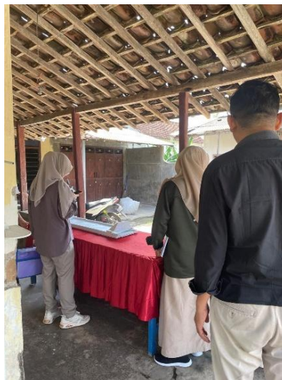
Gambar 4. Kegiatan Pemeriksaan Aset & Persediaan

Selanjutnya, mahasiswa menyusun berita acara pemeriksaan aset dan persediaan sebagai bentuk dokumentasi resmi atas kegiatan yang telah dilakukan. Kegiatan ini tidak hanya meningkatkan kompetensi teknis mahasiswa, tetapi juga berkontribusi terhadap pengembangan soft skills , seperti kemampuan komunikasi profesional, ketelitian dalam melakukan pemeriksaan, serta kemampuan dalam melakukan klarifikasi informasi yang berkaitan dengan pengelolaan aset dan persediaan. Proses pelaksanaan kegiatan pemeriksaan aset & persediaan yang dilakukan mahasiswa dapat dilihat pada Gambar 4 berikut: