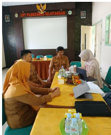
Gambar 3. Kegiatan Pemeriksaan Kas

Sebelum terlibat dalam kegiatan ini, mahasiswa umumnya hanya memahami konsep pemeriksaan kas secara teoritis tanpa pengalaman dalam melakukan perhitungan kas secara langsung di lapangan. Setelah mengikuti kegiatan ini, mahasiswa mampu memahami prosedur pemeriksaan kas secara lebih komprehensif, termasuk pentingnya kesesuaian antara kas fisik dan catatan pembukuan dalam proses audit. Selanjutnya, mahasiswa menyusun berita acara pemeriksaan kas sebagai bentuk dokumentasi resmi atas kegiatan yang telah dilakukan. Kegiatan ini tidak hanya meningkatkan kompetensi teknis mahasiswa, tetapi juga berkontribusi terhadap pengembangan soft skills , seperti kemampuan komunikasi profesional, ketelitian dalam melakukan pemeriksaan, serta kemampuan dalam melakukan klarifikasi informasi yang berkaitan dengan pengelolaan kas. Proses pelaksanaan kegiatan pemeriksaan kas yang dilakukan mahasiswa dapat dilihat pada Gambar 3 berikut: