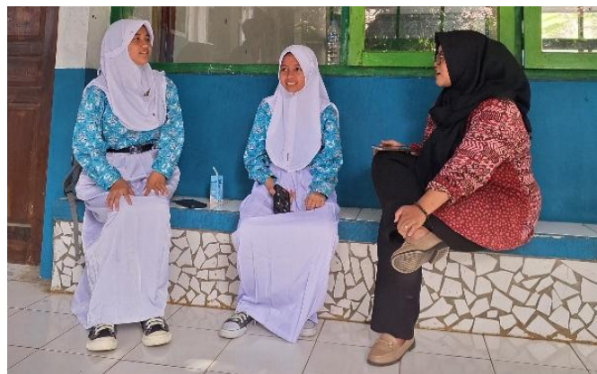
Gambar 2. Proses Pemilihan Lagu dan Latihan

Pada dimensi kognitif dan psikomotorik, otonomi yang diberikan kepada siswa untuk memilih lagu memicu keingintahuan leksikal secara mandiri, yang dibuktikan dengan pemahaman terhadap kosakata kontekstual tingkat lanjut seperti kata " mundane ". Pemerolehan kosakata dan peningkatan ketepatan artikulasi ini memvalidasi temuan Pratiwi dan Yaw-Kan (2025) serta Ejeng et al. (2020), yang membuktikan bahwa integrasi lagu ke dalam pembelajaran memberikan jangkar kontekstual bagi memori jangka panjang. Melodi memfasilitasi repetisi bahasa secara alami, sehingga artikulasi dan pelafalan siswa terlatih secara organik di bawah ambang sadar rasa cemas mereka.