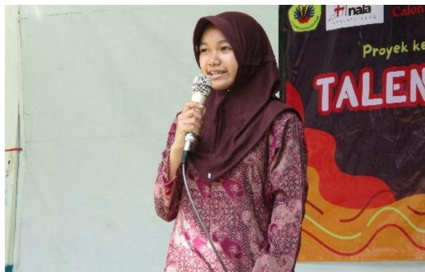
Gambar 3. Penampilan Siswa dalam Program Sing a Song

Keberhasilan mengubah sensasi ancaman ("demam panggung") menjadi pengalaman yang dinikmati ( enjoy ) menyoroti efektivitas pendekatan performatif. Temuan ini menguatkan argumen Aftinia et al. (2025), yang dalam sintesis studinya menegaskan bahwa kegiatan ekstrakurikuler bahasa Inggris yang variatif dan berbasis performa, bukan sekadar latihan tata Bahasa yang secara konsisten terbukti menurunkan kecemasan dan meningkatkan ketertarikan siswa untuk berbagi ide. Ketika siswa berhasil melampaui ketakutan terbesarnya di atas panggung, mereka secara otomatis merekonstruksi identitas mereka dari "pembelajar yang gagal" menjadi "penampil yang berdaya".