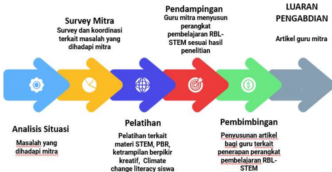
Gambar 1. Tahapan Pelaksanaan Pengabdian