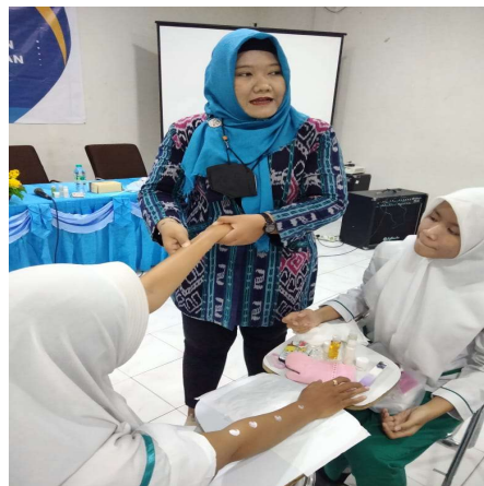
Gambar 2. Demonstrasi Kegiatan

Melakukan Koordinasi Saat melaksanakan Pelatihan di SMK Kesehatan Surabaya, di awali dengan melakukan koordinasi terlebih dahulu kepada pihak guru dengan melalui whatsapp dan Pertemuan kepada guru melakukan observasi di SMK Kesehatan Surabaya perihal materi yang akan di sampaikan. Menyusun Jadwal kegiatan dan mensosialisasikan kepada tim dan kepada mitra Perihal dalam menyusun kegiatan dalam hal ini bersama-sama antara tim dan pihak sekolah harus mengetahui jadwal dalam program pelatihan yang akan di adakan di SMK Kesehatan Surabaya. Adanya suatu rundown acara dalam pelatihat yang adanya pembukaan oleh bapak Program Keahlian , dan sambutan dari pihak tim baru untuk pelaksanaan pelatihan sesuai dengan jobdisk. Menyusun Instrumen PKM Pada melakukan penyusunan instrument untuk mengetahui bagaimna minat suka para peserta didik dalam pelaksanaan pelatihan manicure.