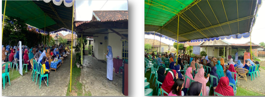
Gambar 2. Pelaksanaan Kegiatan Pengabdian Masyarakat

Kegiatan edukasi kesehatan dilaksanakan dalam bentuk ceramah yaitu penjelasan materi tentang Complementary And Alternative Medicine (CAM) . Adapun urutan pelaksanaan kegiatan edukasi kesehatan dimulai dengan pembukaan, memperkenalkan diri kepada peserta edukasi kesehatan kemudian menjelaskan kegiatan yang akan dilakukan kepada peserta edukasi kesehatan. Jumlah peserta 46 peserta yang merupakan masyarakat Kelurahan Sukodadi Kecamatan Sukarami Palembang.