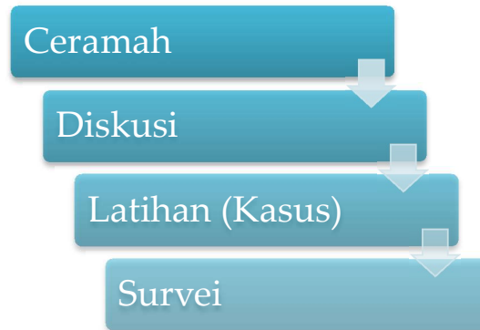
Gambar 1. Tahapan Pelaksanaan PKM

Kegiatan PKM dilaksanakan dengan metode ceramah, diskusi, latihan berbasis kasus, dan survei. Tahapan kegiatan sesuai dengan urutan metode tersebut, seperti ditunjukkan pada Gambar 1.