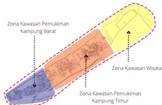
Gambar 1. Peta Zona Kawasan Eksisting Pantai Tanjung Pasir

Data zona kawasan eksisting Tanjung Pasir ditampilkan pada Gambar 1.