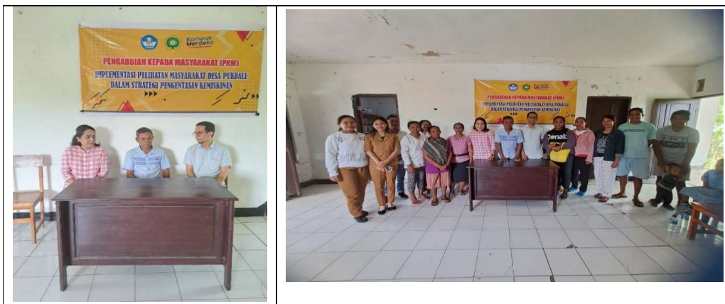
Gambar 3. Workshop Pengentasan Kemiskinan

Selanjutnya, untuk implementasi upaya pengentasan kemiskinan, tim kemudian melanjutkan dengan program kegiatan pelatihan, secara khusus berfokus pada workshop pengentasan kemiskinan dengan mengidentifikasi potensi-potensi yang terdapat disekitar tempat tinggal warga desa (Gambar 3).