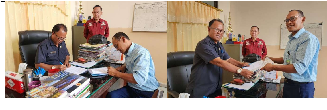
Gambar 1. Penandatanganan Perjanjian Kerjasama