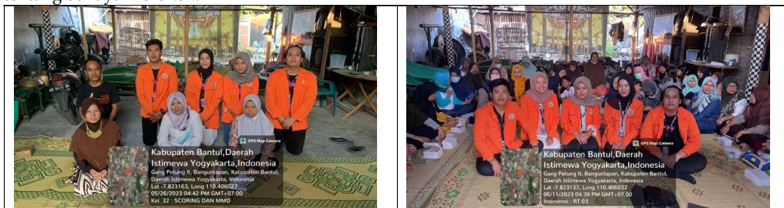
Gambar 4. Proses penentuan masalah dengan USG (kiri). Kegiatan edukasi bahaya asap rokok (kanan)

Intervensi dilakukan di RT 03, Kecamatan Banguntapan, Kabupaten Bantul sebagai solusi dari perilaku merokok di dalam rumah yaitu melakukan sosialisasi di dalam pertemuan rutin ibu-ibu PKK RT 03 Dusun Pringgolayan (Gambar 4). Intervensi di RT 03 Dusun Pringgolayan mengenai masalah perilaku merokok keluarga menasar struktur keluarga terutama ibu. Pada indikator tidak merokok di rumah, para ibu harus bisa mengedukasi seluruh anggota keluarga tentang kesehatan, terutama tentang bahaya merokok.