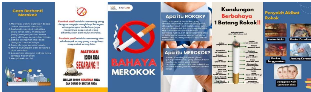
Gambar 3. Leaflet Edukasi Kesehatan Tentang Bahaya Merokok

Intervensi dilakukan di RT 03, Kecamatan Banguntapan, Kabupaten Bantul sebagai solusi dari perilaku merokok di dalam rumah yaitu melakukan sosialisasi di dalam pertemuan rutin ibu-ibu PKK RT 03 Dusun Pringgolayan (Gambar 4). Intervensi di RT 03 Dusun Pringgolayan mengenai masalah perilaku merokok keluarga menasar struktur keluarga terutama ibu. Pada indikator tidak merokok di rumah, para ibu harus bisa mengedukasi seluruh anggota keluarga tentang kesehatan, terutama tentang bahaya merokok.