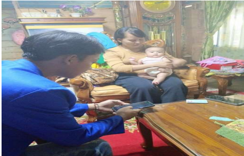
Gambar 2. Mengenalkan Aplikasi Credibook Dan Cara Menginstalasi Aplikasi