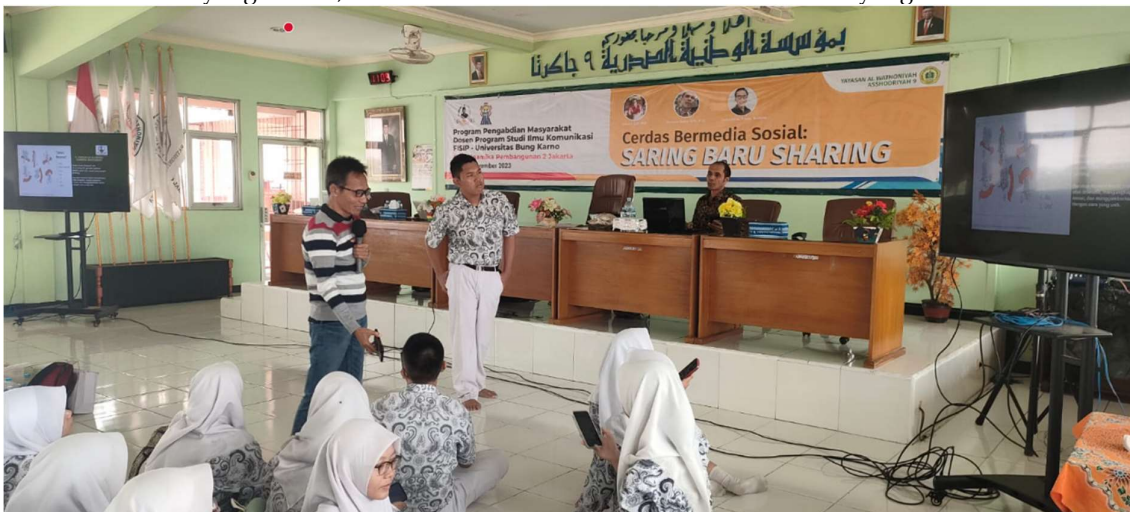
Gambar 3. Pelatihan Cerdas Bermedia Sosial

Misalnya, kenaikan harga kebutuhan pokok. Informasi yang di sampaikan di media sosial tentu hanya pesan-pesan singkat, perlu melakukan mendalami informasi tersebut dengan melakukan monitoring pada informasi yang disajikan pada portal berita yang kredibel. Kebiasaan melakukan filterisasi terhadap informasi yang masuk Semakin sering kita terbiasa untuk menyaring terlebih dahulu informasi yang masuk, maka semakin kecil untuk terhasut informasi yang bersifat hoaks.