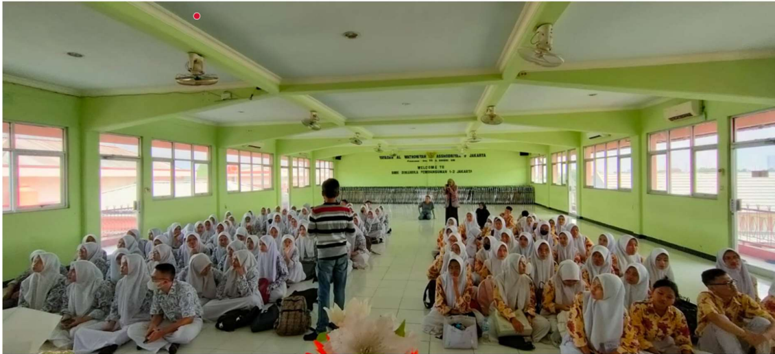
Gambar 2. Pelatihan Cerdas Bermedia Sosial

Selalu terbuka dengan masukan, kritik, maupun koreksi, sehingga postingan mempunyai nilai untuk membangun satu sama lainnya.