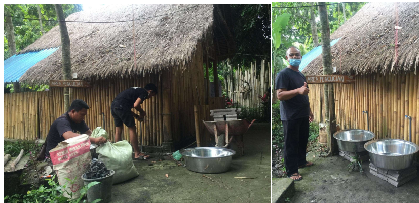
Gambar 5. Penyiapan Area Pencucian

Tanaman gonda setelah dipanen dan disortir, dilakukan proses pencucian sebelum dicacah dan dikeringkan.