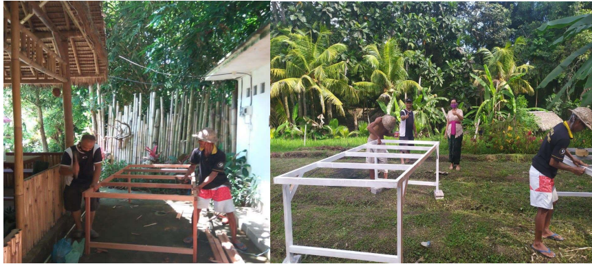
Gambar 3. Penyiapan Meja Jemur Tanaman Gonda