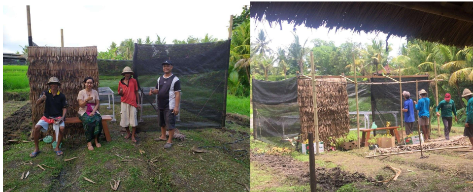
Gambar 4. Penyiapan Area Penjemuran

Menyiapkan area penjemuran dengan membuat sekat sekeliling area pengeringan untuk memastikan kebersihan.