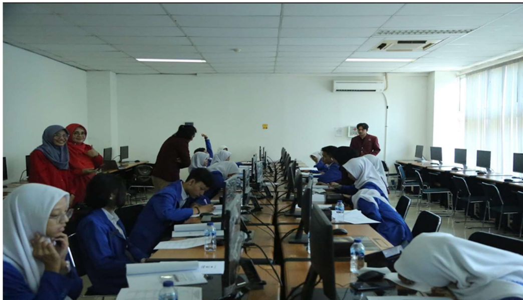
Gambar 2. Foto-foto Kegiatan Pelatihan

Untuk mengukur keberhasilan kegiatan, perlu dilakukan evaluasi oleh masyarakat sasaran dalam hal ini siswa SMK Negeri 3 Bandung. Metode yang digunakan untuk melakukan evaluasi adalah