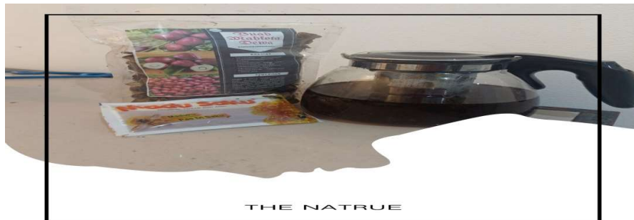
Gambar 3. Ekstrak Minuman Buah Mahkota Dewa

Irisan daging buah kering mahkota dewa sebanyak 1 kg. Buah mahkota dewa yang telah dihaluskan, dimasukkan kedalam sebuah botol gelap dan dimana serasi dengan 2 liter etanol 96% selama 5 hari sambil sesekali diaduk lalu disaring. Proses ini dilakukan sebanyak 3 kali. Filtrat etanol yang di dapat dari hasil perendaman ketiga diuapkan dengan cara invacuo sampai di dapat ekstrak kental etanol.