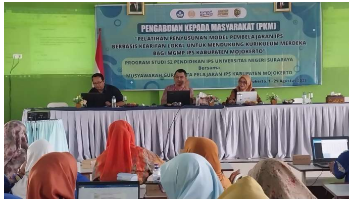
Gambar 3. Pelaksanaan Pelatihan secara Offline