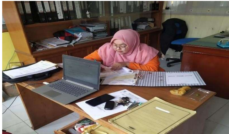
Gambar 3. Proses mengagendakan surat masuk

Setelah menerima surat yang masak penulis langsung mencatatnya ke lembar disposisi, dan register surat masuk, pada lembar disposisi bagian-bagian yang tercatat di dalamnya adalah asal surat, tanggal surat, nomor surat dan tanggal terima surat. Kemudian penulis mencatat ke register surat masuk, pada bagian register surat masuk terdapat tanggal terima surat, nomor surat, tanggal surat, pengirim surat, isi ringkas surat, dan penanggung jawab surat.