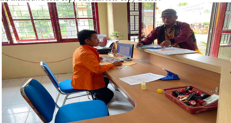
Gambar 6. Melayani Masyarakat Membuat Surat Keterangan Tidak Mampu

Surat keterangan tidak mampu adalah surat yang di pergunakan untuk mengurus kartu atau surat lainnya yang digunakan untuk keperluan keringan Biaya Berobat, Biaya Sekolah, Beasiswa ,Peralihan BPJS dll. Syarat yang harus di bawa oleh pihak yang bersangkutan ialah Surat Rekomendasi dari Wali Nagari, membawa foto copy KK dan foto copy E-KTP.