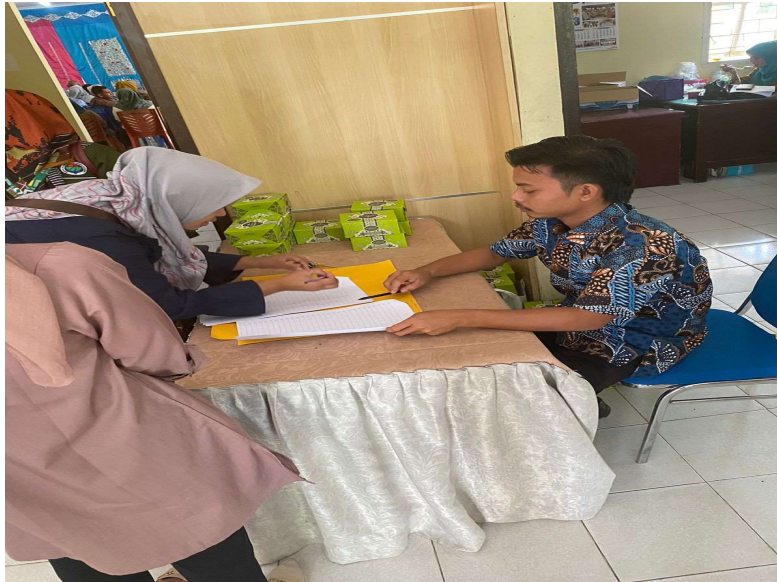
Gambar 5. Menanti Tamu Rakor Nagari

Rakor nagari ialah program kerja Pemerintah Kabupaten bersama Pemerintahan Kecamatan yang bertujuan untuk memantau dan memastikan suatu program serta visi misi Pemerintahan Kabupaten sudah berjalan dengan baik dan di terapkan di tengah-tengah Masyarakat. Penulis menanti tamu yang akan datang ke acara tersebut, masyarakat yang datang disuruh mengisi absen dan memberi snek, lalu tamu undangan mengambil posisi tempat duduk yang telah di sediakan