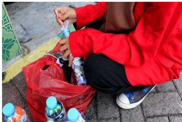
Gambar 3. Mengisi botol bekas dengan cacahan sampah plastik

Program kerja selanjutnya pemanfaatan botol bekas menjadi sebuah “Meja Ecobrick”. Pembuatan meja ecobrick bersama warga merupakan salah satu kegiatan pelestarian lingkungan. Pembuatan “Meja Ecobrick” memanfaatkan berbagai macam sampah plastik yang kemudian dimasukkan ke dalam botol bekas. Kegiatan ini bertujuan untuk mengurangi barang bekas berbahan plastik yang merupakan sampah sulit terurai dan mudah mencemari lingkungan. Pembuatan meja ini dibantu oleh warga, mulai dari pengumpulan alat dan bahan, hingga pembuatannya. Pelaksanaan program kerja dilakukan pada tanggal 20 Agustus 2023 yang diawali oleh pencarian alat dan bahan. Kemudian, pemasukan sampah plastik ke dalam botol plastik dilakukan pada tanggal 21 Agustus 2023 hingga 22 Agustus 2023. Hasil “Meja Ecobrick” ini diselesaikan pada tanggal 23 Agustus 2023, serta presentasi hasil produk dilakukan pada 26 Agustus 2023. Melalui Ecobrick Global Alliance didapatkan bahwa botol bekas yang diisi oleh plastik bekas yang bersih dan kering, dan merupakan kegiatan mencegah plastik menjadi suatu limbah dan polusi. Meja ecobrick ini dapat digunakan sebagai meja mengaji untuk anak-anak.