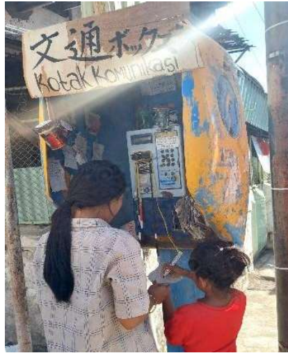
Gambar 2. Antusiasme warga menulis di Kotak Komunikasi

pembicaraan. Banyak warga Kampung Ketandan mulai dari anak-anak hingga orang dewasa yang ikut menulis dalam Kotak Komunikasi ini.