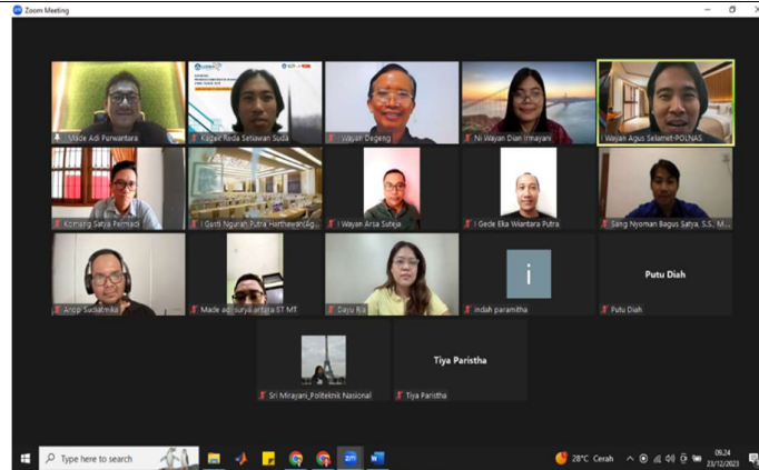
Gambar 2. Foto bersama