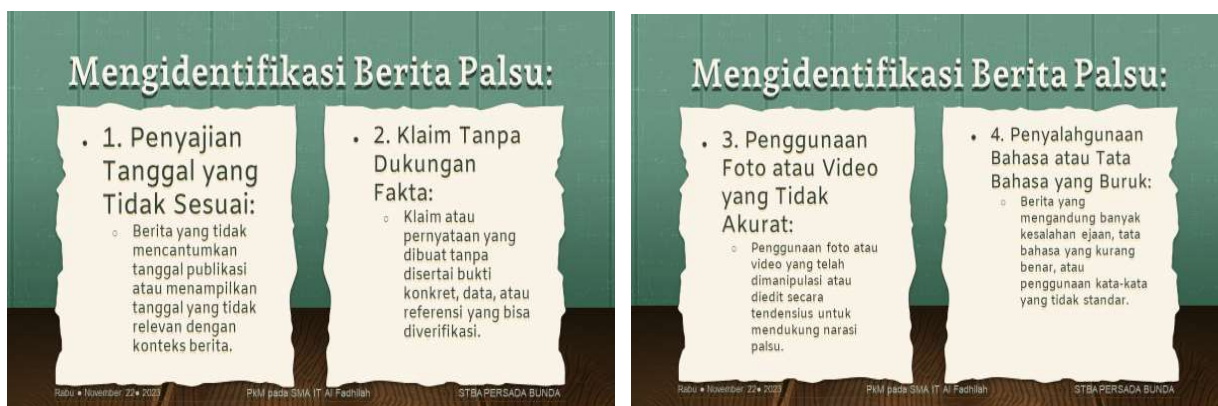
Gambar 6. Materi slide tentang cara mengidentifikasi hoaks

Dengan bersikap waspada, menilai informasi secara kritis, dan mendorong pembagian informasi yang bertanggung jawab, para siswa diharapkan mampu berkontribusi dalam melawan hoax dan mengurangi penyebaran misinformasi. Selanjutnya para siswa juga dibekali cara mengenali berita hoaks seperti cuplikan slide berikut: