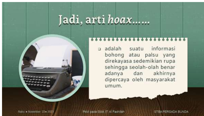
Gambar 3. Materi slide tentang pengertian hoaks

Hoaks adalah informasi yang sengaja dibuat-buat atau menyesatkan, sering kali disebarkan dengan tujuan untuk menipu atau mengelabui orang. Hoaks dapat terjadi dalam berbagai bentuk, seperti cerita palsu, rumor, gambar atau video yang direkayasa, laporan berita palsu, atau informasi menyesatkan yang dibagikan melalui media sosial atau saluran komunikasi lainnya.