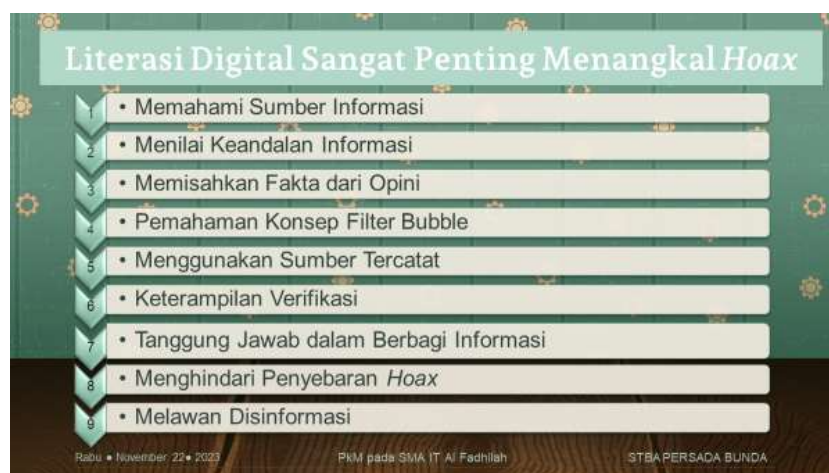
Gambar 4. Materi slide tentang pentingnya literasi digital dalam menangkal hoaks

Mengenali hoaks berarti melibatkan pemikiran kritis, pengecekan fakta, dan memverifikasi informasi dari sumber yang dapat dipercaya sebelum menerima atau membagikannya. Mewaspadaai kemungkinan hoaks dan memahami cara penyebarannya merupakan hal yang penting dalam menghadapi dunia digital saat ini, di mana mis-informasi dapat dengan cepat menyebar. Para siswa juga diberi penjelasan terkait peranan literasi digital dalam menangkal hoaks.