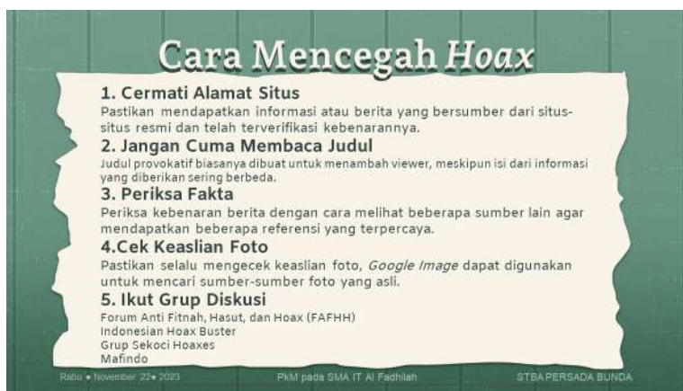
Gambar 5. Materi slide tentang cara mencegah hoaks

Selanjutnya, para siswa dibekali cara mencegah hoaks. Melawan hoax melibatkan kombinasi pemikiran kritis, pengecekan fakta, dan pembagian informasi yang bertanggung jawab. Berikut cuplikan slide tentang cara melawan hoax: