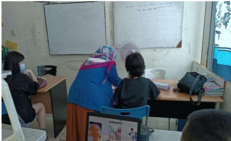
Gambar 6. Panitia Mengarahkan Peserta