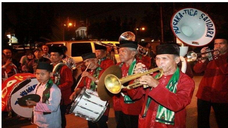
Gambar 4. Tanjidor

Praktek Menulis Berbasis Kearifan Lokal Oleh Peserta PKM