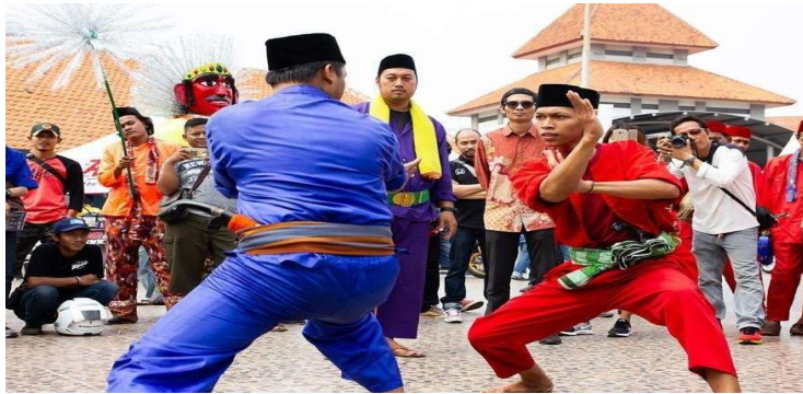
Gambar 3. Palang Pintu