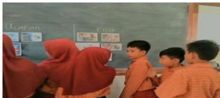
Gambar 2. Siswa mengidentifikasi gambar perundungan

Bentuk perundungan yang terjadi SD Negeri 1 Citangtu yaitu berupa perundungan secara verbal, fisik, dan psikologis. Contohnya adalah mengejek nama orang tua, mencemooh mengenai bentuk badan, mencubit, memukul, dan mendorong yang dapat menyebabkan luka fisik. Evertson dan Emmer, 2015 dalam Prastowo, 2017 mengatakan kecenderungan siswa laki-laki terlibat perundungan fisik, sedangkan siswa perempuan lebih mungkin terlibat dalam agresi dalam hubungan. Ini artinya, bentuk perundungan meliputi tiga jenis, yaitu: fisik, verbal dan non-verbal, serta relasional.