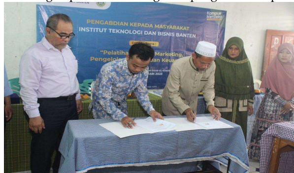
Gambar 2. Penandatanganan Mou dan MoA

Pelaksanaan Kegiatan Pengabdian Kepada Masyarakat (PkM) dengan tema Pelatihan Digital Marketing, Penerapan Digital Marketing Pada Pemasaran Lembaga Pendidikan Pondok Pesantren di PPM Daar El Khairat ini diawali dengan kegiatan penandatanganan MoU dan MoA dari pihak Institut Teknologi dan Bisnis Banten dan PPM Daar El Khairat, kedua belah pihak bersepakat untuk melakukan kegiatan Kerjasama dalam bidang pengajaran, penelitian dan pengabdian kepada masyarakat. Dan dalam pelaksanaan diawali dengan pelaksanaan kegiatan pengabdian kepada masyarakat (PkM).