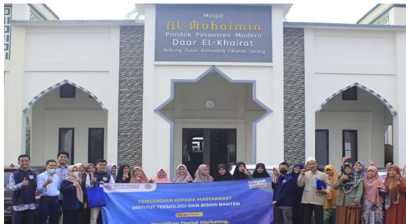
Gambar 4. Foto bersama setelah kegiatan pelatihan

Dalam pelaksanaannya kegiatan PkM ini diikuti sekitar 40 Peserta yang terdiri dari Manajemen Pondok Pesantren, Ustadz/Ustadzah, dan Santri, Peserta sangat antusias untuk menyimak pemaparan terkait materi yang di sampaikan. Setelah sesi materi selesai dilanjutkan dengan sesi tanya jawab antara peserta dan narasumber.