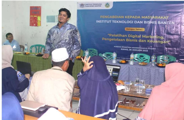
Gambar 3. Pelaksanaan PkM

Dalam pelaksanaannya kegiatan PkM ini diikuti sekitar 40 Peserta yang terdiri dari Manajemen Pondok Pesantren, Ustadz/Ustadzah, dan Santri, Peserta sangat antusias untuk menyimak pemaparan terkait materi yang di sampaikan. Setelah sesi materi selesai dilanjutkan dengan sesi tanya jawab antara peserta dan narasumber.