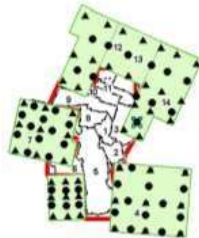
Gambar 5. Desain Premark yang digunakan dalam kegiatan foto udara Desa Girimulyo

Setelah jalur terbang dibuat, selanjutnya adalah membuat desain premark. Premark harus didesain sebelum melakukan akuisisi data foto. Jumlah Premark tiap bidang terdiri dari 9 Ground Control Point (GCP) dan 12 Independent Check Point (ICP). Oleh karena itu, pada setiap bidang, harus dipasang 21 premark yang kemudian diukur dengan menggunakan GNSS Geodetik. Desain Premark yang sudah dibuat dapat dilihat pada Gambar 5.