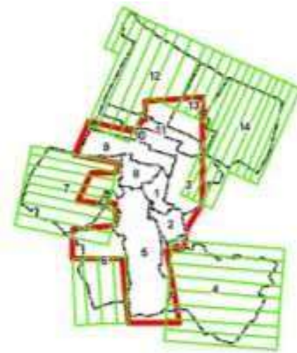
Gambar 4. Desain jalur terbang foto udara di Desa Girimulyo

Setelah jalur terbang dibuat, selanjutnya adalah membuat desain premark. Premark harus didesain sebelum melakukan akuisisi data foto. Jumlah Premark tiap bidang terdiri dari 9 Ground Control Point (GCP) dan 12 Independent Check Point (ICP). Oleh karena itu, pada setiap bidang, harus dipasang 21 premark yang kemudian diukur dengan menggunakan GNSS Geodetik. Desain Premark yang sudah dibuat dapat dilihat pada Gambar 5.