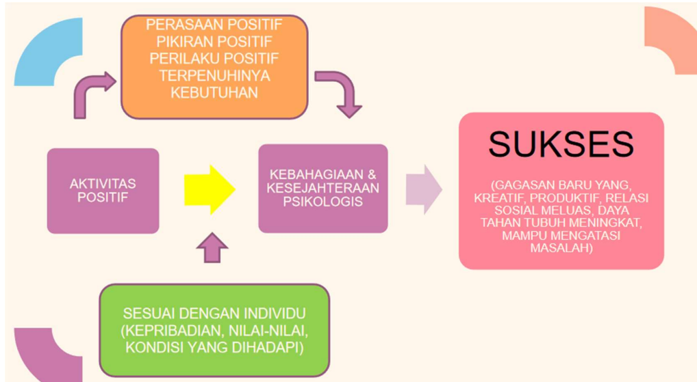
Gambar 5. Fungsi aktifitas Positif

Release emosi, memaafkan dan fokus pada tujuan hidup adalah rangkain terakhir yang harus dilakukan oleh peserta agar dapat mencapai kebahagiaan baik fisik maupun batin. Kesehatan fisik sebagai rangkaian akhir dalam penciptaan perilaku menuju kebahagiaan secara otomatis dapat juga dilakukan dengan melakukan aktifitas fisik seperti berolah raga atau menekuni hoby. Istri maupun Ibu dalam hal ini yang memegang peran ganda diharapkan mampu menjaga Kesehatan mental. Istri maupun ibu menjadi sumber utama kebahagiaan didalam sebuah keluarga, karena itu harus menciptakan aura positif dalam keluarga.