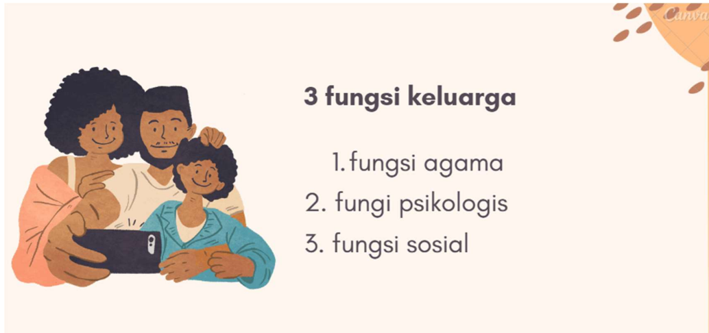
Gambar 2. Visualisasi Orang Bahagia dan Tidak Bahagia

Setelah memahami fungsi keluarga dengan baik, selanjutnya peserta juga diberikan pemahaman terkait gambaran Keluarga yang memiliki Kesehatan mental yang kurang optimal yaitu; Pertama, aspek perasaan. Perasaan mudah terganggu, sensitive, mudah marah, tidak ada ketenteraman batin, cemas yang berlebihan, sedih, iri, sombong, tidak mampu bertanggung jawab, mudah mengeluh, dan selalu menyalahkan orang lain. Kedua, aspek pikiran. Susah menerima ilmu pengetahuan, malas berpikir, susah berkonsentrasi, mudah putus asa, dan selalu berpikiran negative. Ketiga, aspek perilaku. Pada umumnya, perilaku orang yang tidak “sehat” cenderung merusak dan merugikan orang lain, missal mencuri, melakukan korupsi, mengabaikan norma sosial dan agama, berbuat criminal, dan lain-lain.