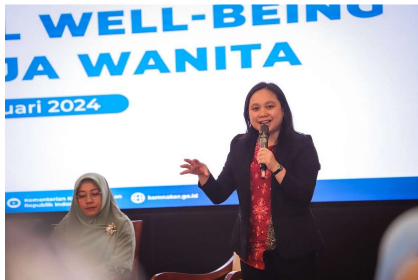
Gambar 3. Pemateri menjelaskan terkait Masalah dalam Rumah Tangga

Keempat, aspek kesehatan fisik. Orang yang kesehatan mentalnya terganggu akan berdampak pula pada kesehatan fisiknya, seperti kepala sering pusing, mudah lemas, sering masuk angin, sering pingsan, dan penyakit fisik lainnya yang tidak diketahui penyebabnya sama sekali (Dona Fitri Anisa; Ifdil, 2016)