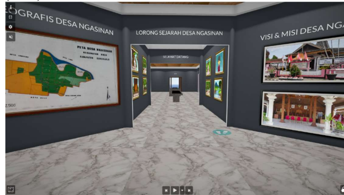
Gambar 2. Tampak Depan Artsteps

Cukup banyak fasilitas peribadatan yang terdapat di Desa Ngasinan, di antaranya Mushola Ar Rohim, Mushola Al Muttaqin, Mushola LDII, dan Masjid Nurul Huda. Sedangkan untuk fasilitas kesehatan tingkat pertama yang terdapat di Desa Ngasinan yaitu bidan desa dan bidan Ny. Rumiwati. Selanjutnya untuk fasilitas umum, yang dapat digunakan untuk warga Desa Ngasinan, yaitu lapangan bola Desa Ngasinan, beberapa lapangan voli yang tersebar di beberapa dukuh, dan satu gedung olahraga serbaguna (GOR).