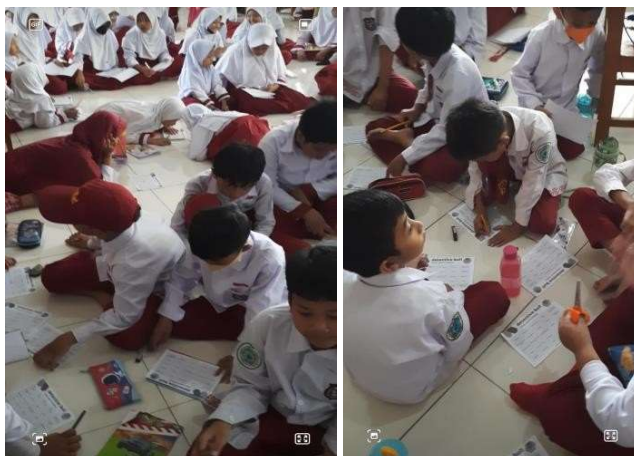
Gambar 3. Proses Pengisian Lembar Invesitasi Detective Bull

Setelah menyelesaikan permainan Detective Bull ini diperoleh beberapa nama siswa yang terindikasi menjadi pelaku, korban dan saksi dalam kasus perundungan yang sering terjadi di sekolah. Selanjutnya data ini akan dijadikan bahan kajian oleh Agen Anti Perundungan Sekolah untuk ditindaklanjuti, dengan menyusun rencana bantuan baik yang sifatnya psikologis maupun non-psikologis. Diharapkan dengan terlaksananya kegiatan ini upaya pencegahan dan penanggulangan perilaku perundungan di sekolah dapat diminimalisir bahkan dicegah.