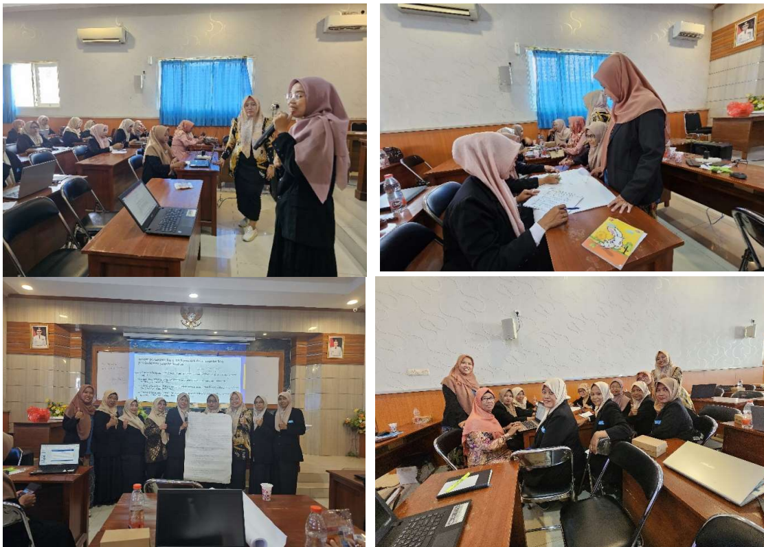
Gambar 4. Kegiatan Demonstrasi Konstektual, Elaborasi Pemahaman, Koneksi Antar Materi, dan Rencana AKSI Nyata

Pemantauan dan evaluasi yang ketat terhadap implementasi program-program pendidikan telah memberikan gambaran yang jelas tentang perubahan yang terjadi. Evaluasi ini memungkinkan kami untuk melakukan penyesuaian jika diperlukan, sehingga efektivitas dari kegiatan pengabdian ini dapat terus ditingkatkan.