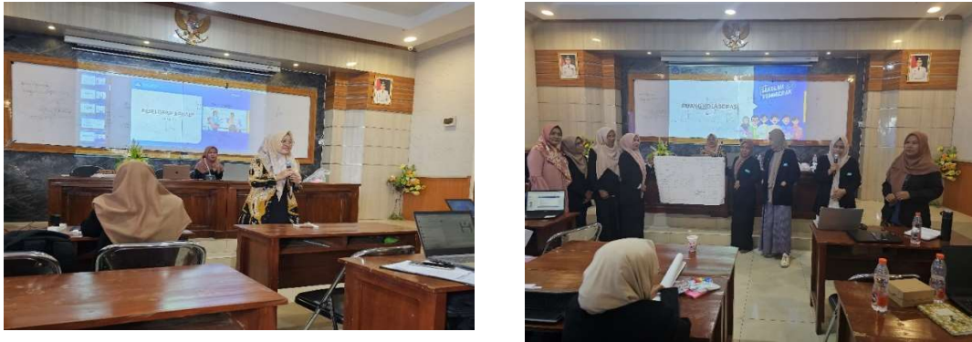
Gambar 3. Kegiatan Eksplorasi konsep dan Ruang Kolaborasi

Pemantauan dan evaluasi yang ketat terhadap implementasi program-program pendidikan telah memberikan gambaran yang jelas tentang perubahan yang terjadi. Evaluasi ini memungkinkan kami untuk melakukan penyesuaian jika diperlukan, sehingga efektivitas dari kegiatan pengabdian ini dapat terus ditingkatkan.