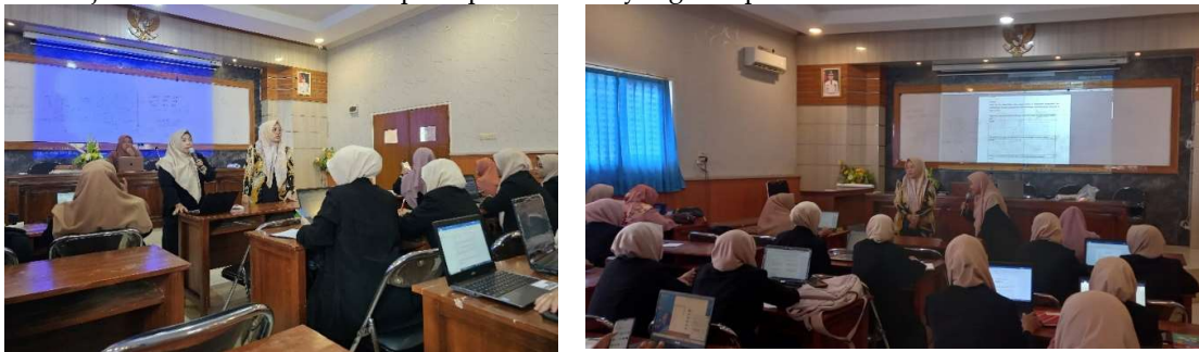
Gambar 2. Kegiatan Pembukaan dan Ice Breaking

Hasil dari kegiatan pengabdian masyarakat yang Penulis laksanakan menghasilkan dampak yang signifikan pada sektor pendidikan di Sekolah Penggerak Kabupaten Lamongan Angkatan 3. Berdasarkan data survei awal, kami berhasil memahami situasi pendidikan yang ada, mengidentifikasi tantangan yang dihadapi oleh guru dan siswa, serta potensi perbaikan yang dapat diterapkan. Melalui serangkaian lokakarya yang Penulis selenggarakan, para guru dan tenaga pendidik di sekolah-sekolah mitra Sekolah Penggerak Angkatan 3 Kabupaten Lamongan mengalami peningkatan dalam penerapan pendekatan berpusat pada siswa. Peserta juga mengembangkan keterampilan pedagogis yang diperlukan dan mendalami pemahaman mengenai kurikulum Sekolah Penggerak. Partisipasi aktif para peserta dalam sesi-sesi diskusi, studi kasus, dan simulasi pembelajaran berkontribusi besar pada pemahaman yang komprehensif.