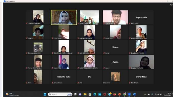
Gambar 2. Foto Bersama di akhir sesi