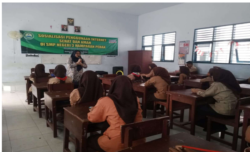
Gambar 2. Pemaparan Materi 1

Pengabdian masyarakat dengan tema Sosialisasi Penggunaan Internet Sehat dan Aman di SMP Negeri 3 Hamparan Perak berjalan lancar, peserta didik menyimak pemaparan materi dan berdiskusi oleh tim pelaksana pengabdian masyarakat yang berasal dari Universitas Budi Darma.