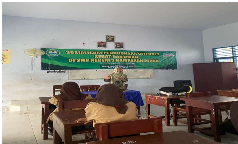
Gambar 3. Pemaparan Materi 2