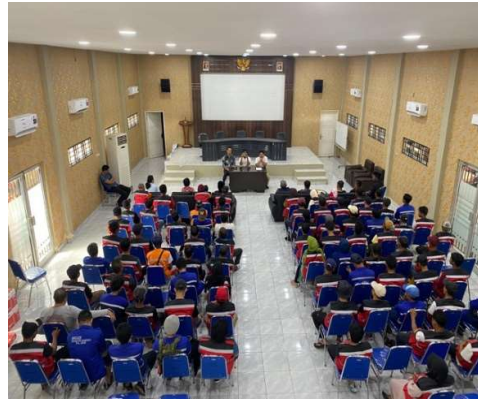
Gambar 3. Penerimaan Materi

Pemberian materi mengenai data-data penggunaan internet di Indonesia, serta manfaat penggunaan sosial media sebagai bentuk kampanye lingkungan. Dalam diskusi ini hampir semua peserta telah memiliki akun sosial media. Tujuan dari materi ini adalah untuk mendapatkan pemahaman tentang bagaimana penggunaan sosial media saat ini merupakan metode yang efektif untuk menjangkau khalayak.