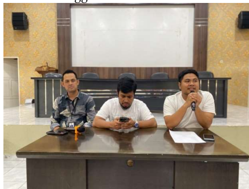
Gambar 2. Pembukaan Pimpinan Kecamatan

Pada tanggal 03 Maret 2024, kelompok tim melakukan kegiatan dengan memberikan materi di balai pertemuan Kecamatan Manggala. Seminar tatap muka dihadiri oleh 50 peserta, diantaranya adalah pengelola Kebersihan pada Kecamatan Manggala termasuk anggota kebersihan lapangan (penyapu jalan, pengangkut sampah fukuda, pengangkut sampah mobil tangkasaki), serta masyarakat sekitar. Kegiatan ini berlangsung secara tatap muka langsung dihadiri oleh Kepala Seksi Kebersihan Lingkungan Kecamatan Manggala serta Camat Kecamatan Manggala.