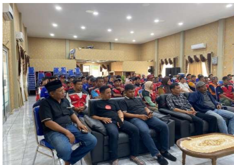
Gambar 5. Kegiatan Sosialisasi