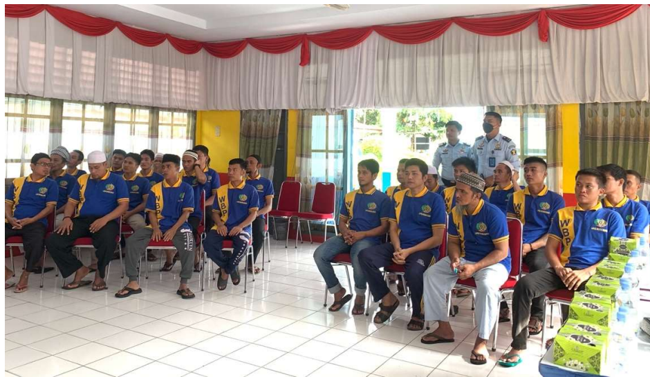
Gambar 2. Diseminasi Aspek Kesehatan “Pola Hidup Sehat Jiwa dan Raga”

Peserta yang mengikuti kegiatan pendampingan terdiri dari Warga Binaan yakni Narapidana Klas IIB Muara Bungo. Pada hari pelaksanaan peserta yang hadir berjumlah 25 orang. Kegiatan diawali dengan acara pembukaan oleh Ketua Pengabdian dan Kepala Lembaga Pemasyarakatan Klas IIB Muara Bungo. Setelah itu dilanjutkan dengan kegiatan Diseminasi dan Pendampingan Refleksi Diri. Adapun yang menjadi inti materi yang diberikan dalam kegiatan Diseminasi yaitu Penerapan pola perilaku hidup bersih dan sehat, Membangun karakter melalui islah diri, Urgensi peningkatan kesadaran hukum warga binaan, dan Pembentukan konsep diri positif.