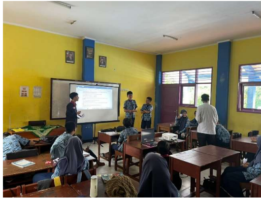
Gambar 3. Diskusi langsung dengan Siswa