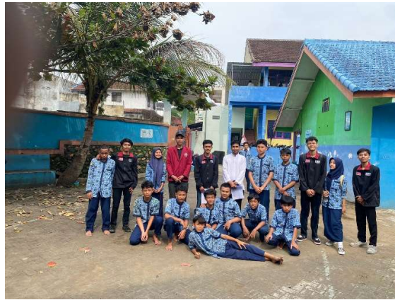
Gambar 4. Dokumentasi bersama Siswa pasca Pelatihan

Kegiatan pengabdian ini diikuti oleh 20 siswa kelas VIII SMP Muhammadiyah 6 Malang. Hasilnya menunjukkan bahwa 90% siswa dapat memahami materi yang diberikan. Hal ini dapat dilihat dari hasil tes yang diberikan kepada siswa setelah kegiatan pengabdian. Siswa juga menunjukkan antusiasme yang tinggi dalam kegiatan demonstrasi dan praktik. Mereka banyak bertanya dan ingin mencoba membuat reaktor biogas sendiri. Hal ini menunjukkan bahwa siswa tertarik dengan biogas dan ingin mempelajari lebih lanjut materi ini.