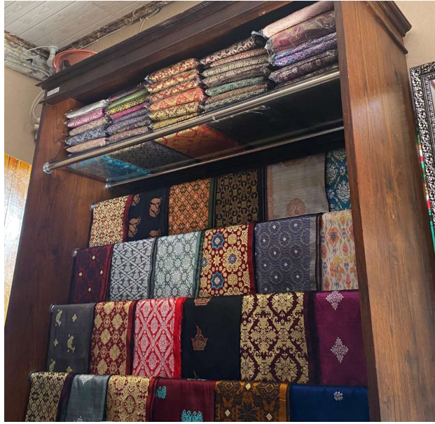
Gambar 2. Songket Jambi