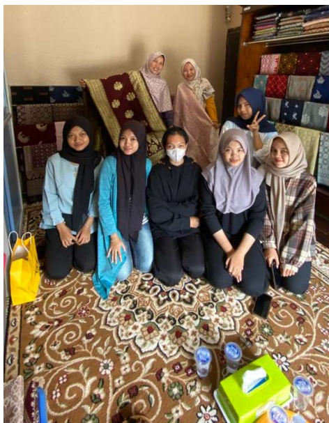
Gambar 3. Dokumentasi Kegiatan Pengabdian

Dengan demikian, pengabdian ini memberikan wawasan mendalam tentang keberagaman alat pembuatan songket, proses pembuatannya, serta makna filosofi dan budaya yang melandasi kebudayaan songket Jambi. Temuan ini dapat menjadi dasar bagi upaya pelestarian dan pengembangan lebih lanjut.