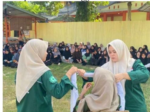
Gambar 4. Penggunaan Mitela Pada Cedera Kepala

Kepala merupakan bagian penting dari tubuh manusia, cedera pada kepala dapat menyebabkan kefatalan (lumpuh atau meninggal). Untuk penanganan cedera kepala di gunakan mitela yang dilipat sesuai keperluan, teknik penanganan cedera yang didemonstrasikan pada kegiatan ini seperti cedera pada dahi, cedera pada dagu, cederah pada mata, cedera pada kepala bagian atas, cedera bahu dan cedera lengan/tangan. Diawali dengan melakukan observasi pada cedera, dilanjutkan pembersihan cedera, penangan pendarahan dan pembalutan menggunakan mitela.