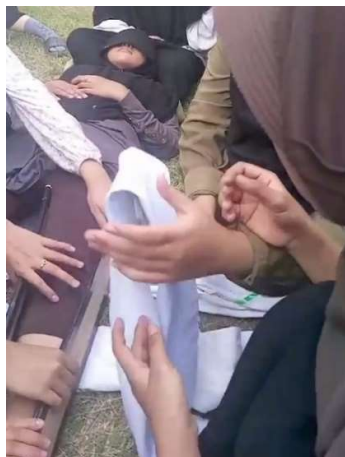
Gambar 6. Siswa Melakukan Praktek Pembidaian Patah Kaki

Setelah sesi demonstrasi yang di lakukan oleh mahasiswa prodi Keselamatan dan Kesehatan Kerja (K3) Universitas Abulyatama Aceh kemudian dilanjutkan dengan praktek langsung dari perwakilan peserta. Peserta di bagi kedalam 5 kelompok, setiap kelompoknya di awasi oleh seorang mahasiswa, 2 kelompok mempraktekkan penanganan cedera pada kepala dan 3 kelompok melakukan praktek penanganan patah, peserta secara bergantian melakukan praktek penanganan cedera pada kepala dan patah. Disini terlihat peserta awalnya masih ragu dan takut tetapi setelah diberi contoh dan arahan cara melakukan penanganan kecelakaan mereka dapat melakukannya dengan baik. Pada kegiatan edukasi dan pelatihan ini terlihat jelas antusiasme peserta sangat besar mereka dengan cepat menangkap instruksi-instruksi yang di berikan oleh mahasiswa.