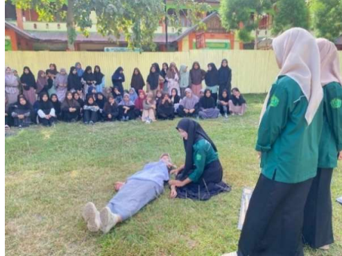
Gambar 5. Simulasi Pembidaian Korban Patah

melakukan observasi pada keseluruhan tubuh korban kemudian dilanjutkan dengan pemeriksaan tubuh korban secara fisik bagian per bagian sekaligus memberi penilaian kondisi korban. Kemudian dua orang mahasiswa melakukan demonstrasi penanganan patah pada korban kecelakaan menggunakan bidai dan mitela. Kegiatan demonstrasi di akhiri dengan peragaan teknik transportasi korban yang sudah ditangani.