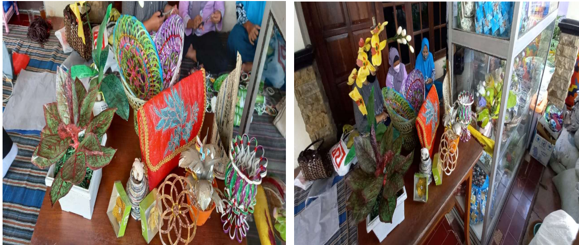
Gambar 3. Kegiatan

Dengan menyusun sistem monitoring dan evaluasi ini, diharapkan dapat memberikan pemahaman yang mendalam tentang efektivitas program dan memberikan landasan bagi pengembangan program serupa di masa depan.