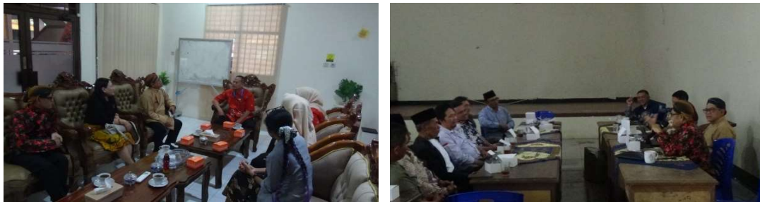
Gambar 3. Sosialisasi Rencana Program Pengabdian dan FGD Dengan Pemangku Kebijakan