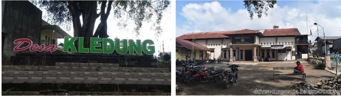
Gambar 2. Desa Kledung dan Kantor Desa Kledung

Penerapan strategi pengembangan produk pariwisata juga menjadi bagian integral dari kegiatan pengabdian. Mitra diajak untuk mengidentifikasi dan mengelola potensi alam dengan cara yang tidak hanya menguntungkan secara ekonomis, tetapi juga menjaga kelestarian lingkungan dan nilai-nilai budaya lokal. Dengan demikian, Desa Kledung dapat membangun reputasi sebagai destinasi wisata yang berkelanjutan dan bertanggung jawab, menjadikannya pilihan utama bagi wisatawan yang mencari pengalaman yang autentik dan berkesan.