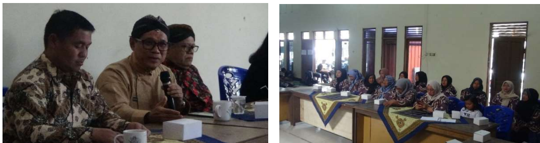
Gambar 4. Penyampaian Materi Pengabdian