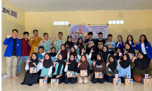
Gambar 5. Dokumentasi panitia dan peserta

akan memberikan manfaat dan sebagai motivasi siswa dan siswi untuk bisa lebih banyak atau rutin melakukan literasi membaca.