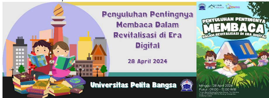
Gambar 1. Banner dan poster penyuluhan

Kegiatan dimulai dengan melakukan survey wilayah dan sasaran kegiatan, perijinan, dan sosialisasi dengan pihak Rumah Dilan Bintang Raharja terkait rencana kegiatan. Instrumen kegiatan yang dipersiapkan antara lain media pelatihan dan penyuluhan (Materi pelatihan, poster, banner, dan alat tulis) dan peralatan. Publikasi dikonfirmasi dengan ketua Rumah Dilan Bintang Raharja dan didistribusikan kepada Remaja melalui media, undangan, dan pengumuman langsung. Persiapan lain meliputi konsumsi dan doorprize .