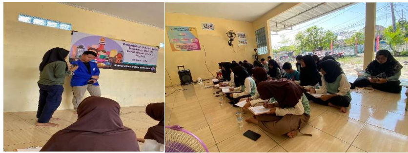
Gambar 3. Sesi diskusi dan evaluasi