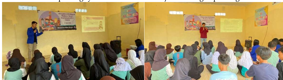
Gambar 2. Penyampaian materi dan bedah buku

Kegiatan Penyuluhan Pentingnya Membaca dalam Revitalisasi Literasi di Era Digital terdiri dari pemahaman tentang pentingnya literasi dan membaca di era digital, bedah buku dan games yang berkaitan dengan literasi dan pentingnya membaca. Evaluasi dilakukan dengan cara memberikan diberikan pretest dan posttest sebelum dan sesudah petihan dengan soal-soal yang berkaitan dengan pemahaman literasi dan pentingnya membaca serta dilanjutkan dengan pembagian sertifikat.