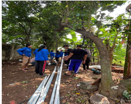
Gambar 5. Pemasangan pipa saluran air (2)