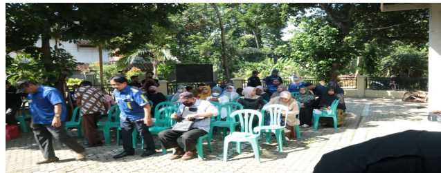
Gambar 10. Pelaksanaan peresmian hibah PPIB (4)