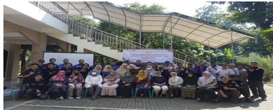
Gambar 9. Pelaksanaan peresmian hibah PPIB (3)