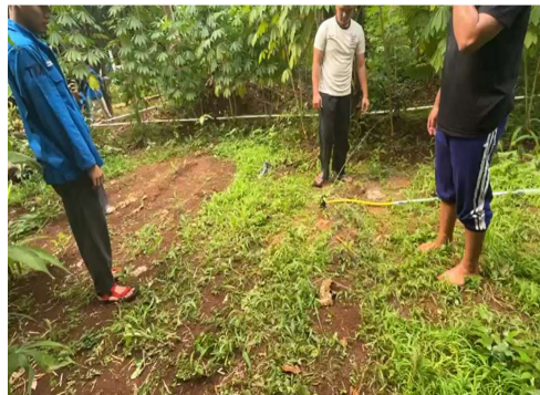
Gambar 6. Pemasangan sprinkle saluran air