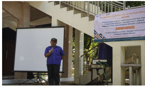
Gambar 8. Pelaksanaan peresmian hibah PPIB (2)