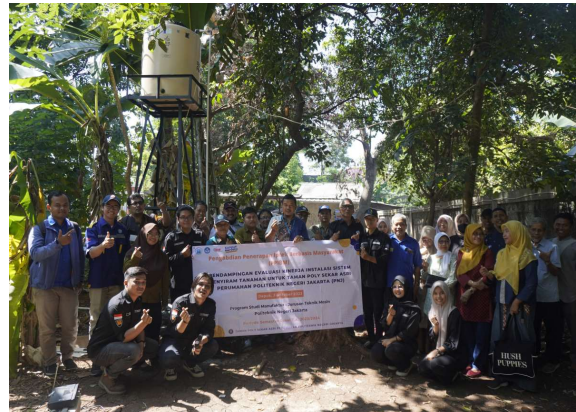
Gambar 13. Pelaksanaan pendampingan evaluasi hibah PPIB (2)