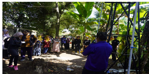
Gambar 11. Pelaksanaan peresmian hibah PPIB (5)