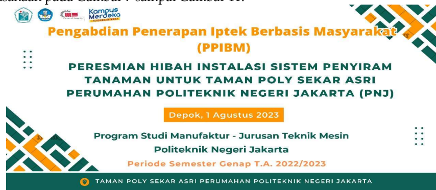
Gambar 7. Pelaksanaan peresmian hibah PPIB (1)

Kegiatan peresmian Hibah PPIB dilaksanakan pada tanggal 1 Agustus 2023 dengan rincian bukti pelaksanaan pada Gambar 7 sampai Gambar 11.