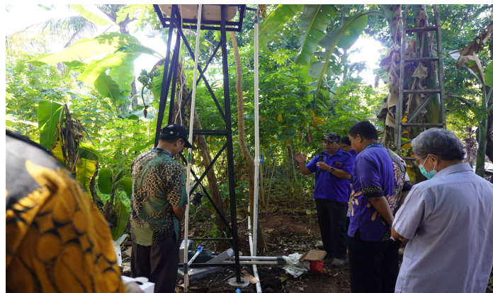
Gambar 14. Pelaksanaan pendampingan evaluasi hibah PPIB (3)