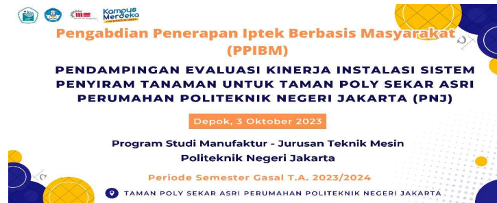
Gambar 12. Pelaksanaan pendampingan evaluasi hibah PPIB (1)